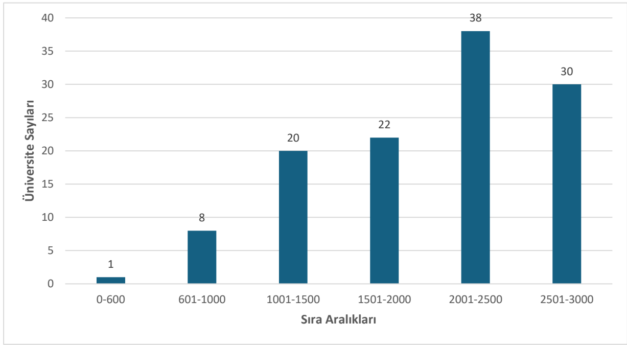
Şekil 1. URAP 2023-2024 dünya sıralamasında altı farklı sıra aralığında yer alan Türk üniversitelerinin sayıları

Üniversitelerimizin çoğu dünyanın en iyi üniversitelerinin düzeyine yükselebilmek için yoğun çaba harcamaktadır. URAP dünya sıralamasında 2016'dan bu yana ilk 500'e girebilen bir üniversitemizin kalmaması ve 2016'da ilk 1000'de 18 olan üniversite sayımızın da 9'a düşmesi bu çabaların etkili olmadığını göstermektedir. Bu nedenle, tüm üniversitelerimizin daha fazla çaba göstererek etki değeri yüksek dergilerdeki makale sayılarını hızla artırmaları gerekmektedir. Son yıllarda bunu en iyi başaran ülke Çin olmuştur. Çin'in URAP 2023-2024 dünya sıralamasında; ilk 100'de 23, ilk 500'de 95, ilk 2000'de 355 ve ilk 3000'de 489 üniversitesi yer almıştır. Çin'in en başarılı 9 üniversitesinin durumu Tablo 3'te verilmektedir.